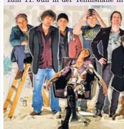
Patent Ochsner spielen am Samstag in Gstaad